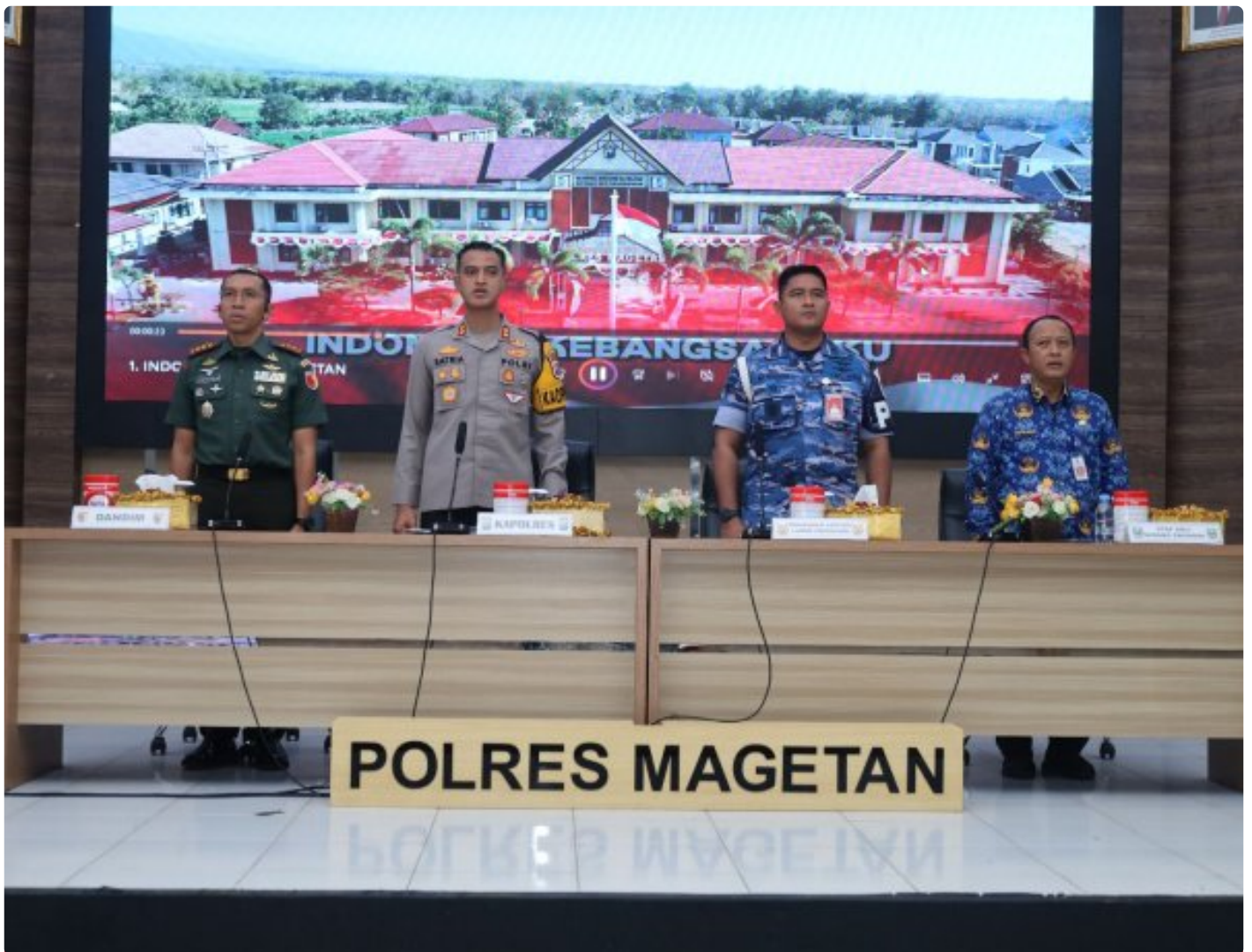
Dandim 0804/Magetan Hadiri Rakor Lintas Sektoral kesiapan operasi lilin 2024

Magetan. – Guna meningkatkan Sinergitas dalam rangka kesiapan operasi lilin 2024 pengamanan Hari Raya Natal 2024 dan Tahun Baru 2025 di wilayah Kabupaten Magetan yang aman dan kondusif.